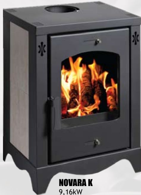
NOVARA K 9,16kW 560 x 460 x 840mm 86kg