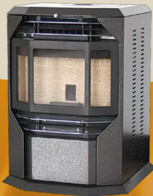
HP20 10KW 900 x 670 x 625mm