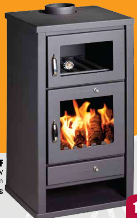
DELUX F 11,31kW 484 x 479 x 913mm 100kg