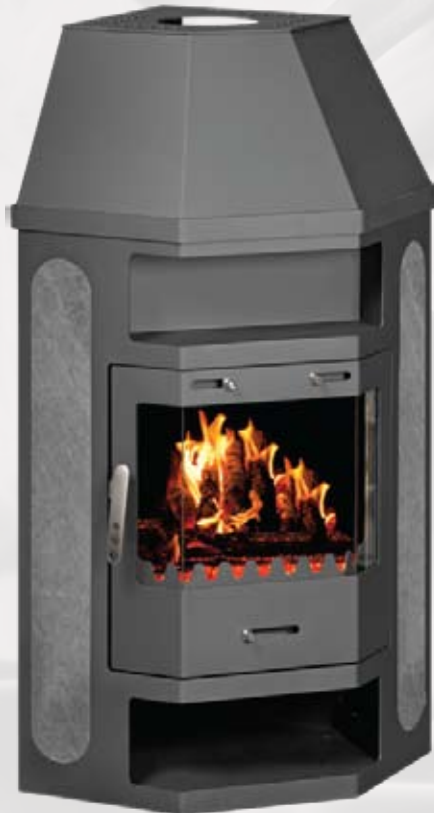
PEARL AS 14kW 530 x 490 x 1114mm 142kg