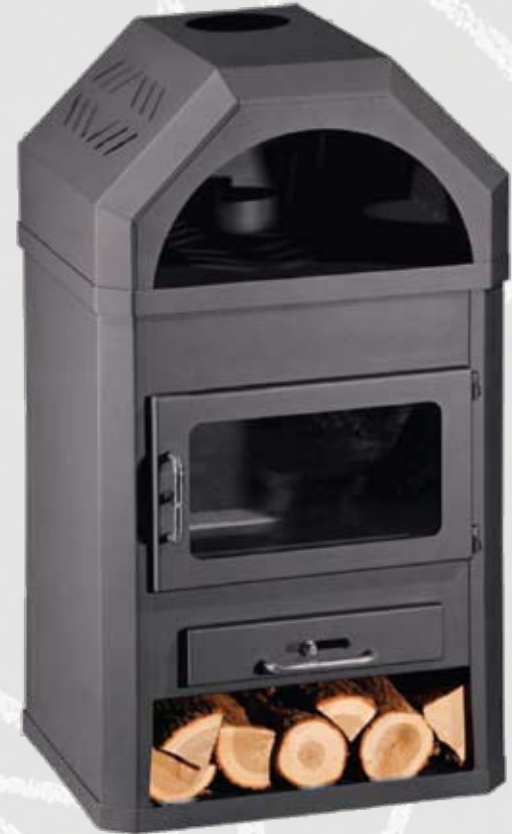
LOTOS MAX B 12kW 650 x 615 x 1165mm 125kg