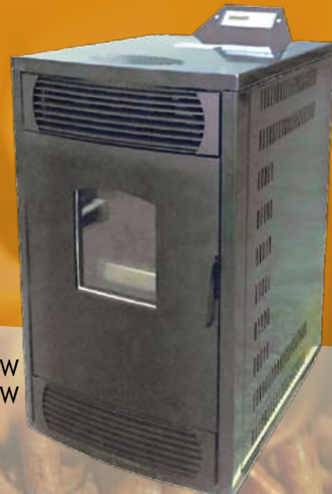
WPS005B 11KW WPS005C 14KW