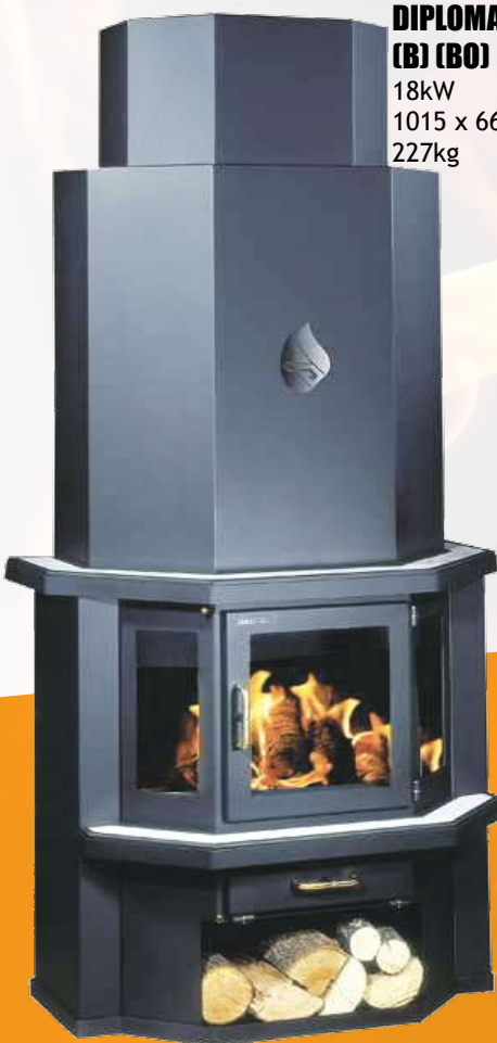
DIPLOMAT 21 (B) (BO)

* όπου BO = δοχείο νερού κλειστού κυκλώματος