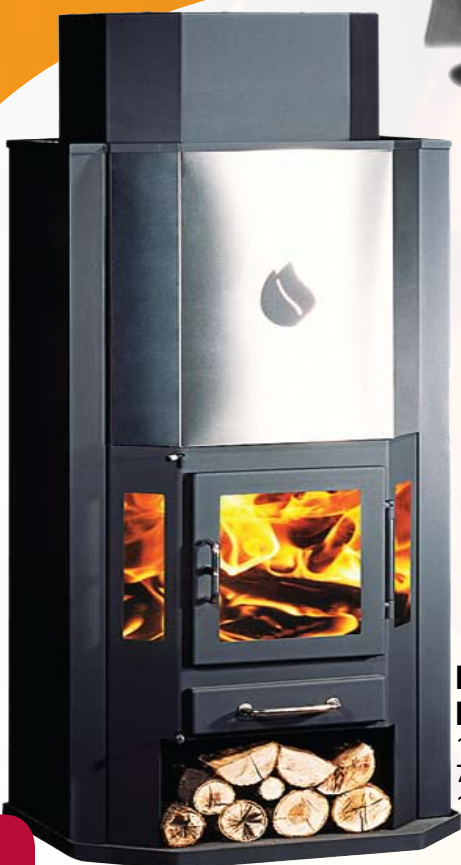
DIPLOMAT 11 INOX (B)