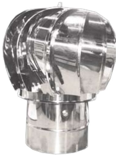
150HAT - VE