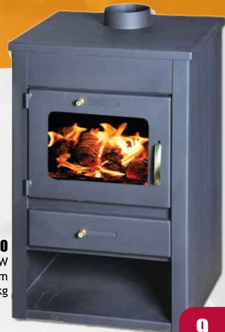
STILO 9kW 474 x 400 x 870mm 68kg