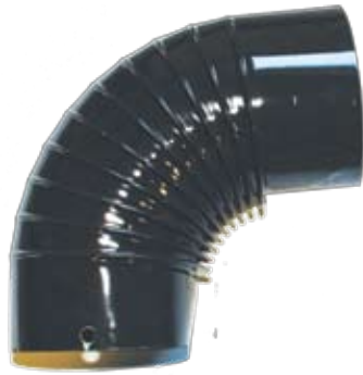
Γωνία Χρώματος: Μαύρο Ματ, Καφέ & Μαύρο Γυαλιστερό.