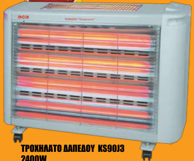
ΤΡΟΧΗΛΑΤΟ ΔΑΠΕΔΟΥ KS90J3 2400W

POWERFUL 2400W (Max Locked Motor Wattage)