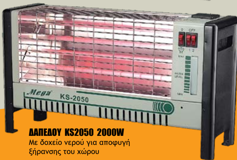
ΔΑΠΕΔΟΥ KS2050 2000W Με δοχείο νερού για αποφυγή ξηράνσης του χώρου

POWERFUL 2400W (Max Locked Motor Wattage)