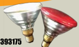
393175 ΛΑΜΠΑ ΘΕΡΜΑΝΣΗΣ 175W