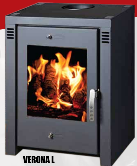
VERONA L 9,16kW 556 x 458 x 750mm 85kg