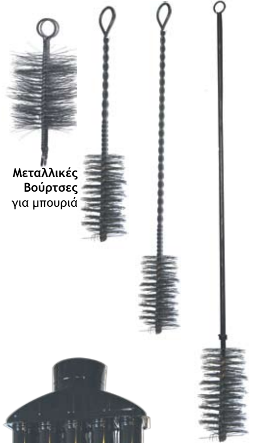
Μεταλλικές Βούρτσες για μπουριά