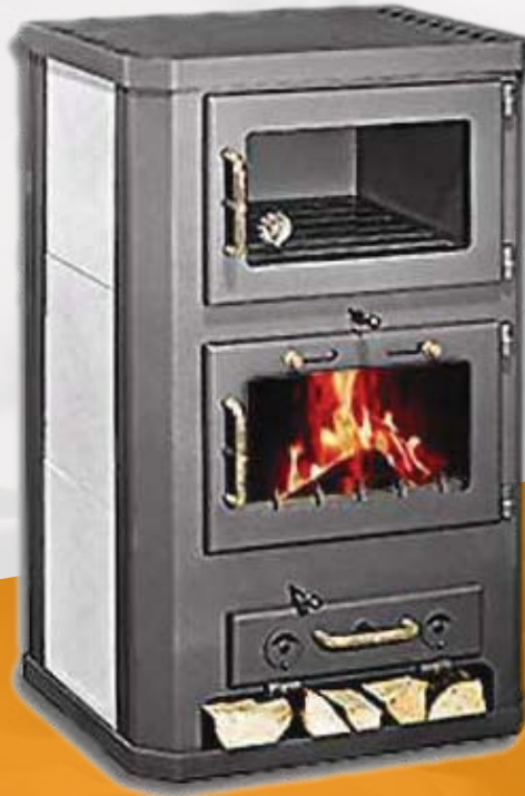
KOMFORT 21 KFT 10kW 585 x 545 x 970mm 142kg