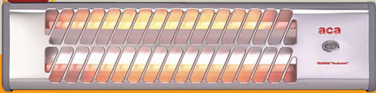
ΤΟΙΧΟΥ KS90E 800W

POWERFUL 800W (Max Locked Motor Wattage)