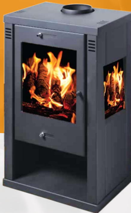
VISION 7,52kW 510 x 420 x 950mm 80kg