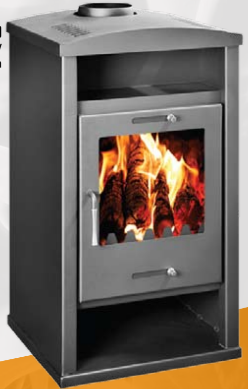
LUX (2B) 7 - 8,5kW 484 x 505 x 905mm