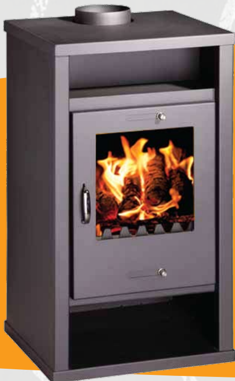
DELUX (B) 12kW 484 x 495 x 913mm 113kg