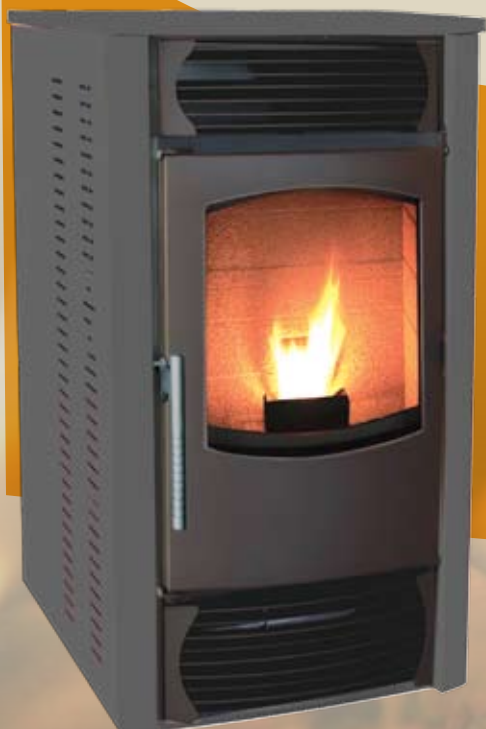
HP24 9KW 850 x 450 x 528mm