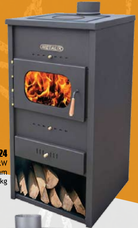
024 21kW 500 x 490 x 930mm 75kg