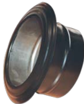
Θερμοπαγίδα - Radiator