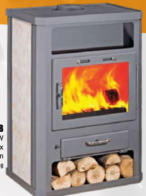
GRANDE B 14,5kW 682 x 542 x 980mm 147kg