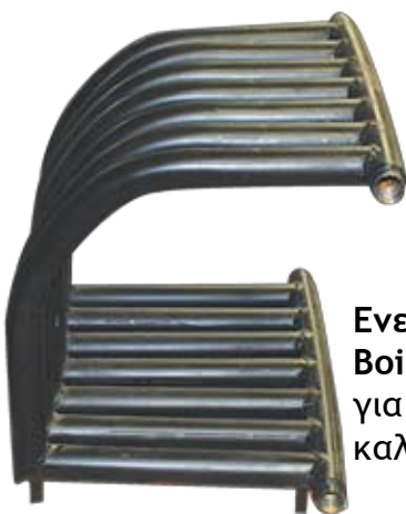
Ενεργειακό Boiler τζακιού για σύνδεση με καλοριφέρ