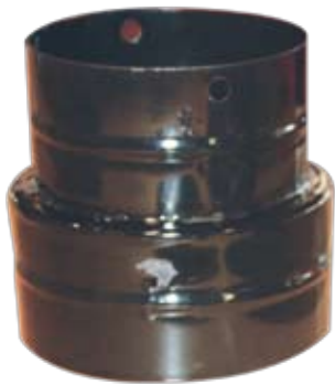
Συστολή Χρώματος: Μαύρο Ματ, Καφέ & Μαύρο Γυαλιστερό.