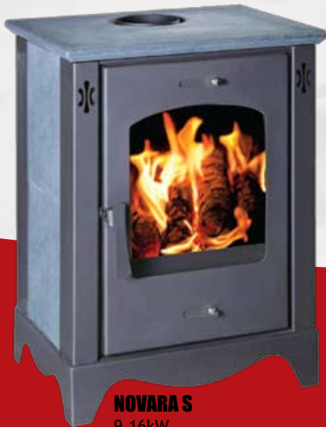
NOVARA S 9,16kW 590 x 475 x 840mm 107kg