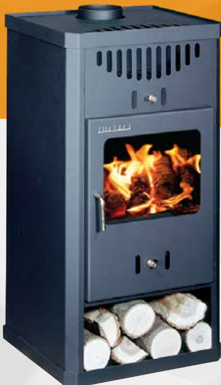
ELEGANT B 9,5kW 485 x 505 x 930mm 90kg