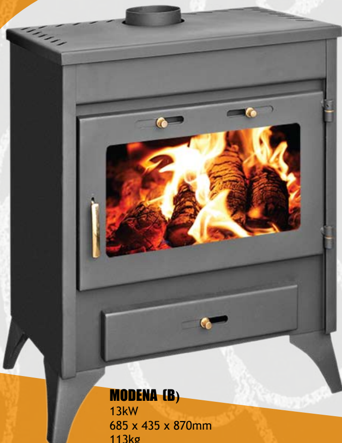
MODENA (B) 13kW 685 x 435 x 870mm 113kg