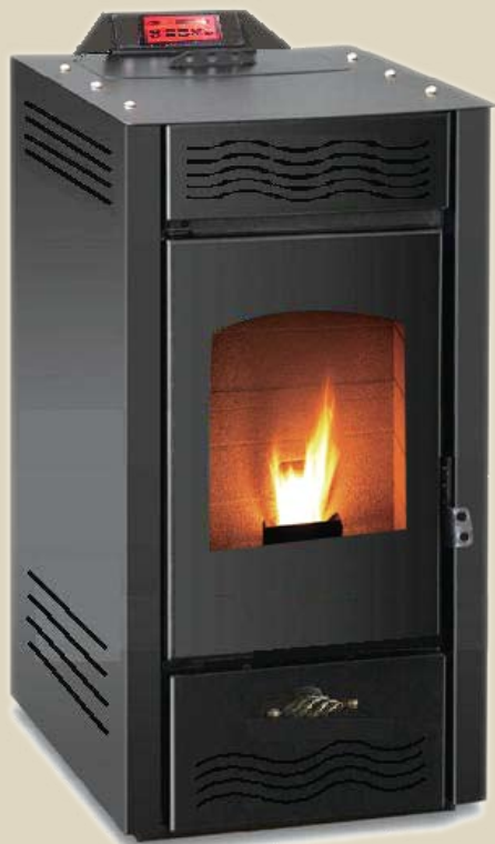
RM-22F 13KW 854 x 470 x 500mm