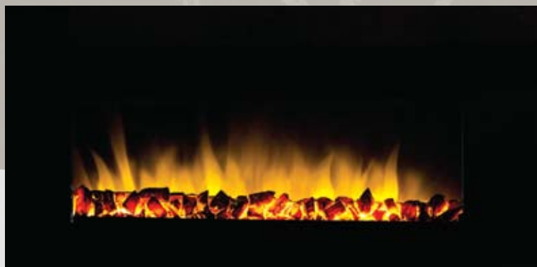
WSG032 80/750/1500kW 1003 x 464 x 155mm 17kg