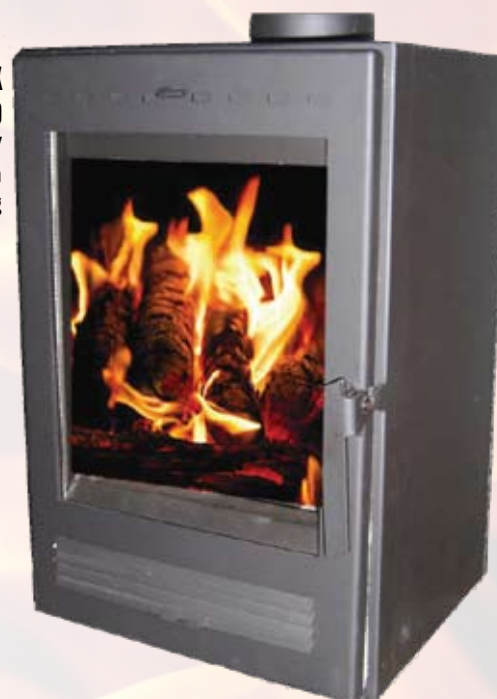
FIREBOX SPECTRA BO 8kW 540x 518 x 680mm 153kg