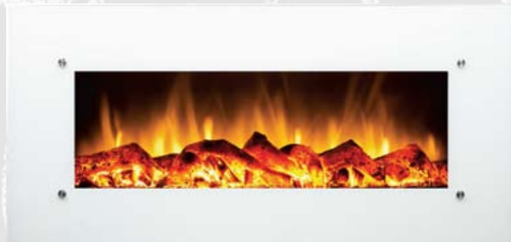
WSG02 80/750/1500kW 1280 x 550 x 165mm 20kg