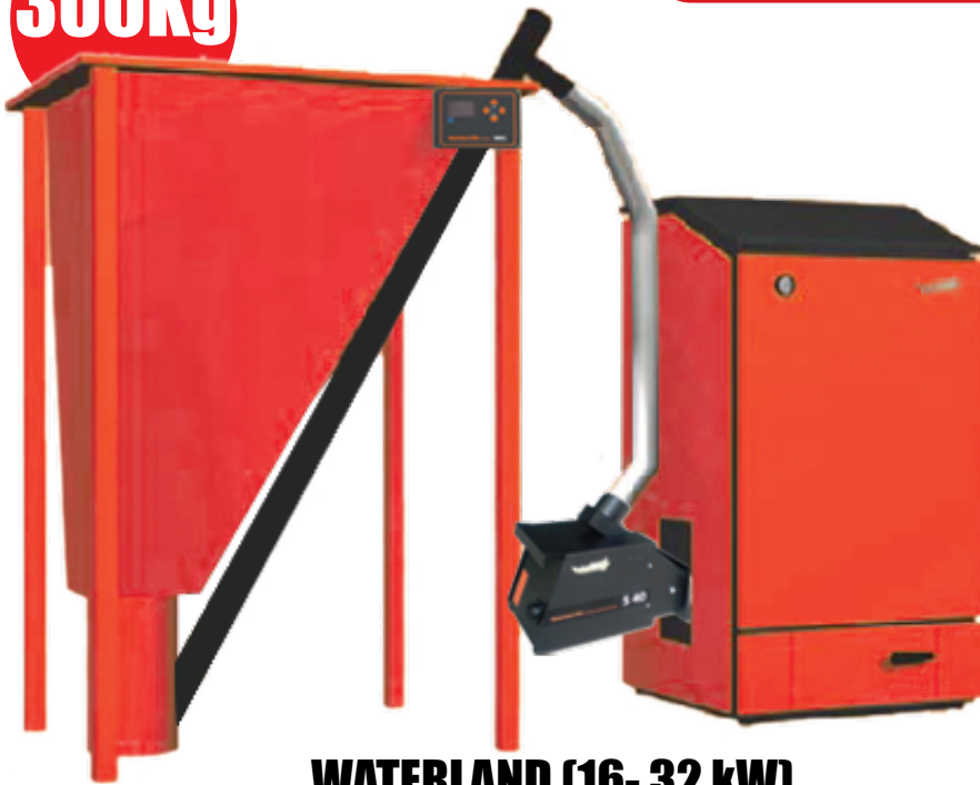
WATERLAND (16- 32 kW)