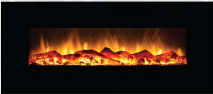
WSG01 80/750/1500kW 1280 x 550 x 165mm 20kg