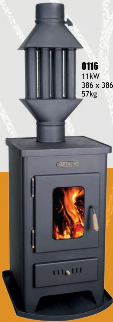
0116 11kW 386 x 386 x 810mm 57kg