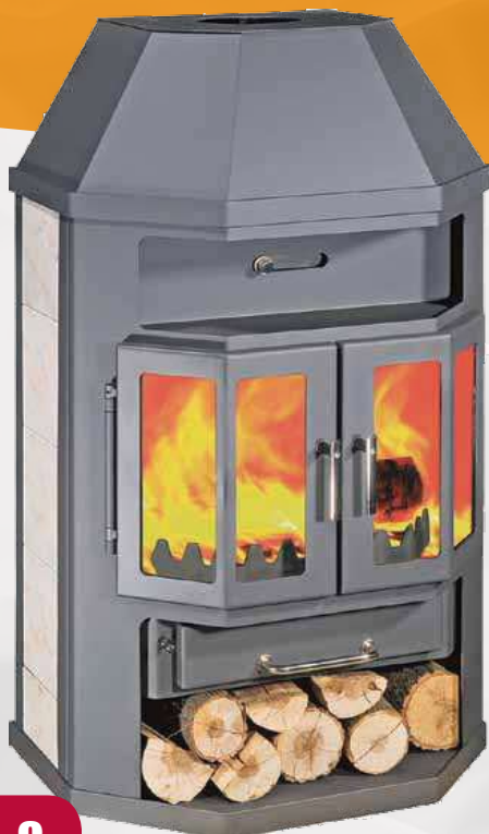
GRANDE LUX A B 14,5kW 682 x 542 x 1220mm 188kg