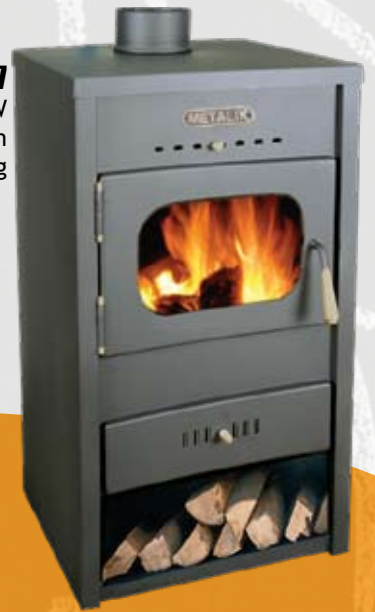
017 13kW 455 x 415 x 830mm 58kg