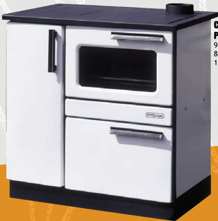
COOKER PLAMAK LUX (B) 9kW 840 x 570 x 845mm 130kg