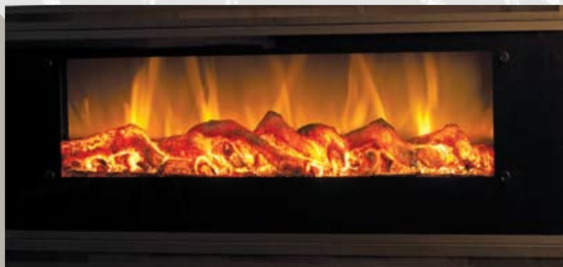
WSG01Q 80/750/1500kW 1280 x 470 x 163mm 22,3kg