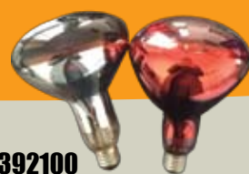
392100 ΛΑΜΠΑ ΘΕΡΜΑΝΣΗΣ 250W