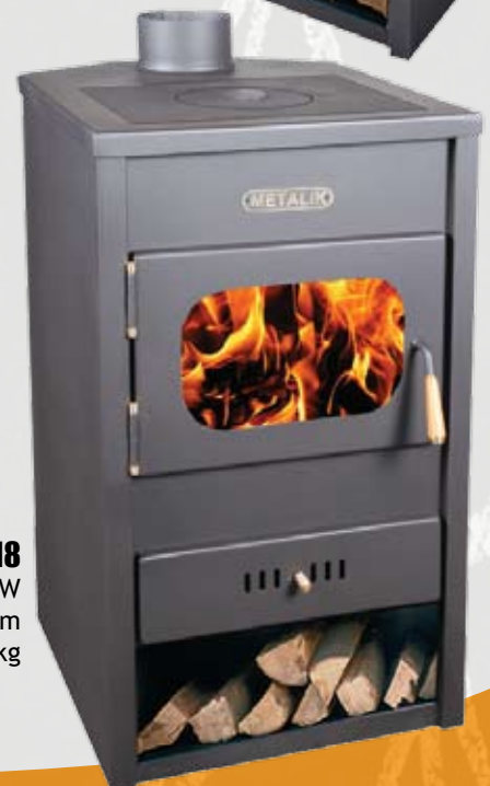
018 13kW 455 x 500 x 830mm 65kg