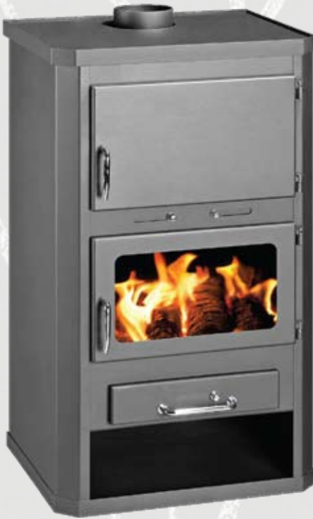
LOTOS MAX 25 B 25kW 650 x 615 x 1185mm 227kg