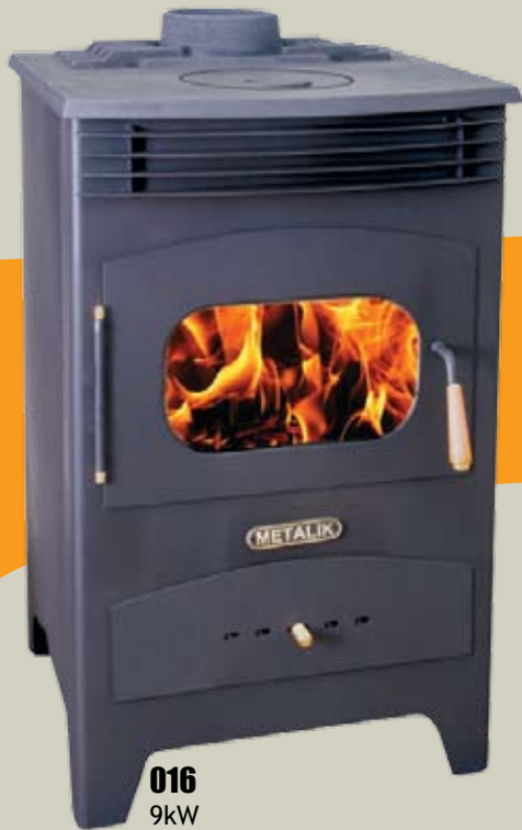
016 9kW 430 x 445 x 730mm 56kg