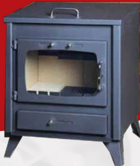
PANDORA C 9kW