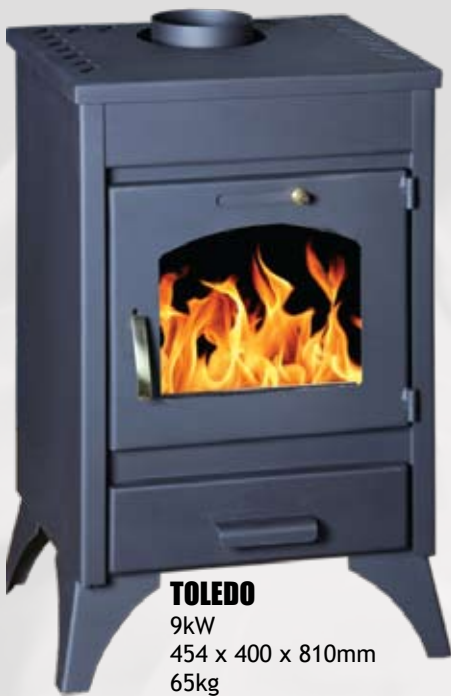
TOLEDO 9kW 454 x 400 x 810mm 65kg