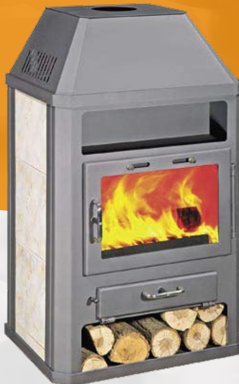
GRANDE AB 14,5kW 682 x 542 x 1220mm 182kg