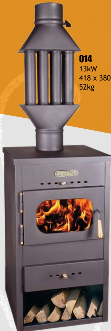
014 13kW 418 x 380 x 815mm 52kg