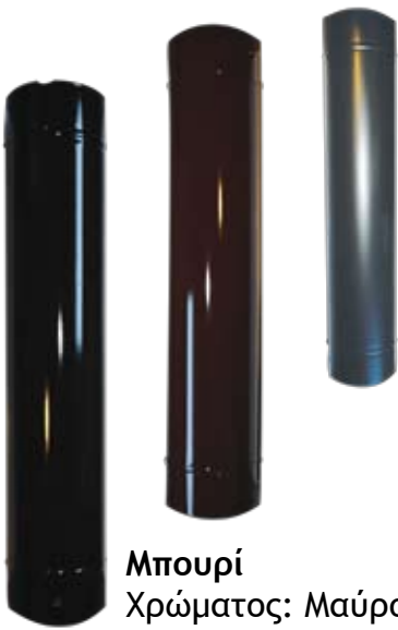
Μπουρί Χρώματος: Μαύρο Ματ, Καφέ & Μαύρο Γυαλιστερό.