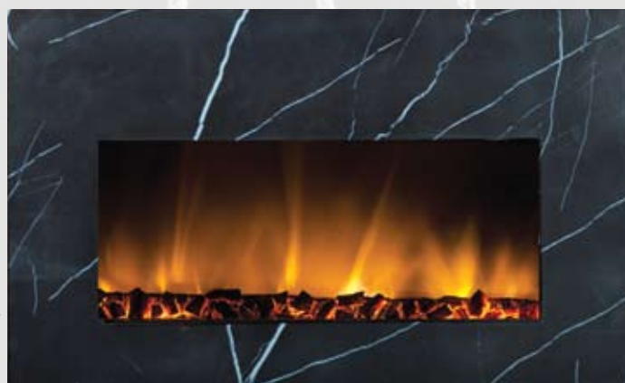
WSG038 80/750/1500kW 720 x 475 x 140mm 15kg