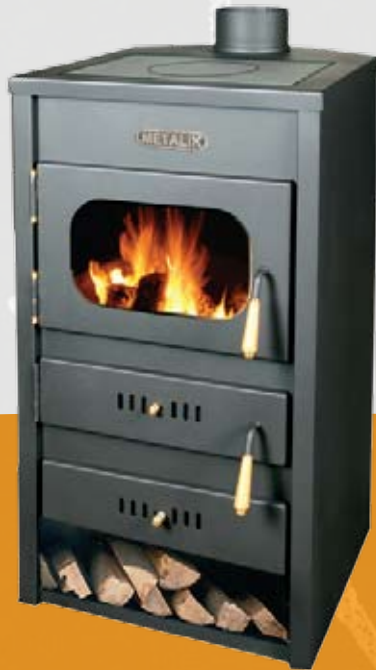
033 13kW 455 x 500 x 895mm 66kg