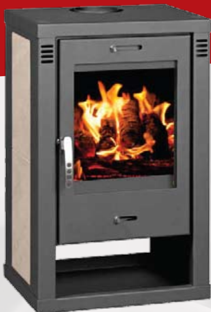
VERONA K 9,16kW 556 x 458 x 910mm 90kg