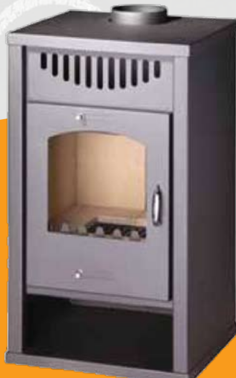
DELUX E 12kW 484 x 495 x 913mm 114kg