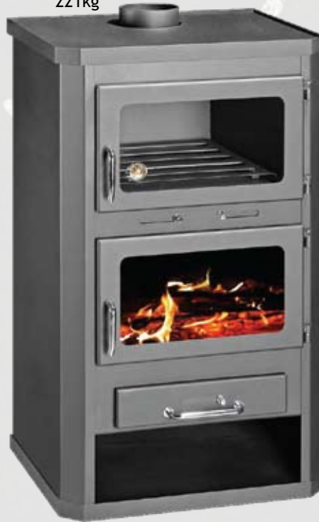
LOTOS MAX FTB 18 18kW 650 x 615 x 1185mm 221kg