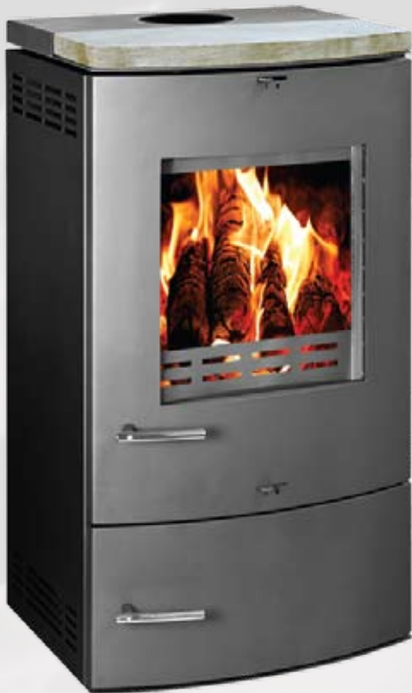
LIVORNO S 9,5kW 610 x 525 x 1080mm 150kg