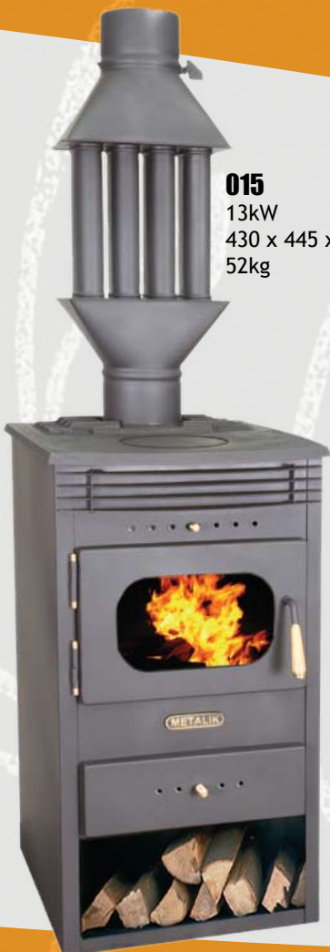
015 13kW 430 x 445 x 800mm 52kg