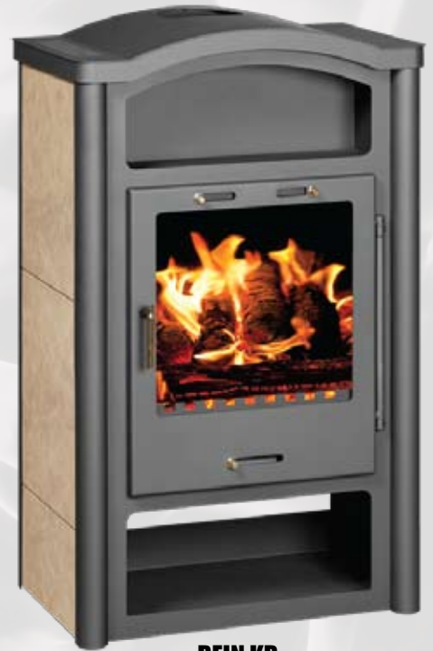
REIN KB 13,5kW 681 x 510 x 1175mm 178kg