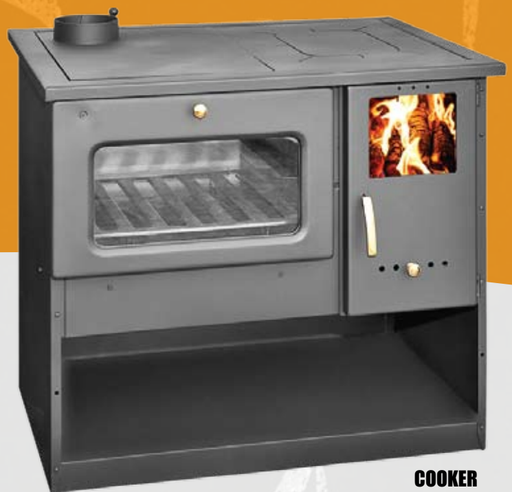
COOKER METALOURGIA M 9kW 840 x 570 x 775mm 72kg