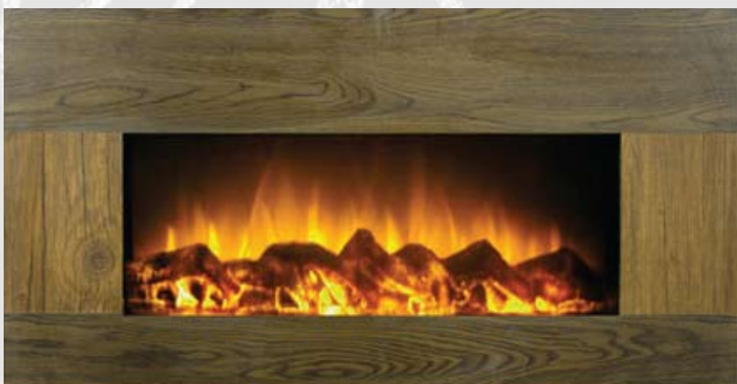
WSG022 80/750/1500kW 910 x 455 x 140mm 15kg