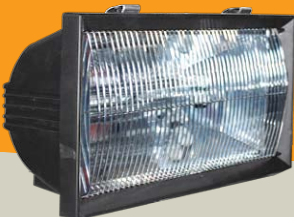
AC.0450063 ΠΡΟΒΟΛΕΑΣ ΘΕΡΜΑΝΣΗΣ ΣΤΕΓΑΝΟΣ IP65 1300W