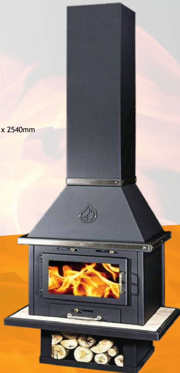
UYUT LUX INOX (B)